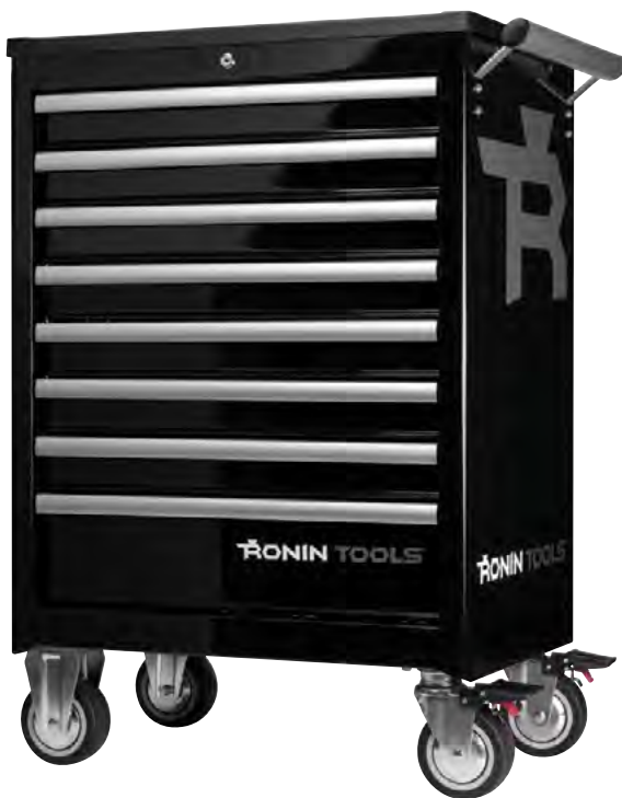
Tühi tööriistakapp 10.001.000

Keskklukustus tagab tööriistade turvalise hoidmise