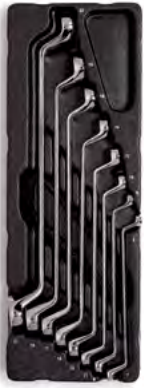
2-poolsed astmega silmusvõtmed (Metric)