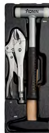
Vasar + lukustiga tangid 45.250.000 3-osaline komplekt Lukksepvasar 500 g / nailonvasar / ümara otsaga lukustiga tangid