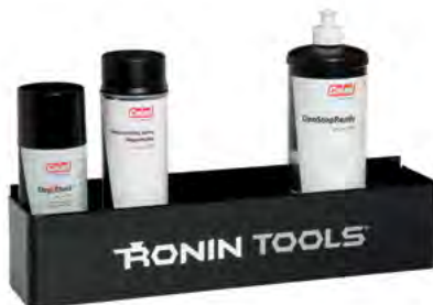
Spray-pudelite hoidja 10.000.001

Lihtne paigaldada kahe kaasas oleva kruviga. Kruviaugud on igal Ronin tööriistakapil olemas.