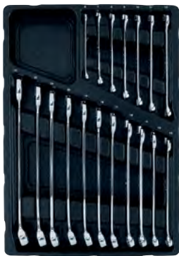
Leht-silmusvõtmete komplekt (Metric)