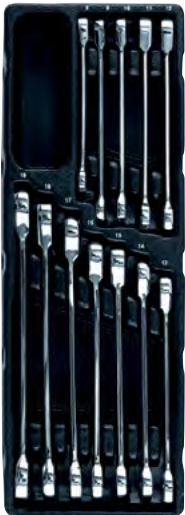
Käristiga leht-silmusvõtmed (Metric)