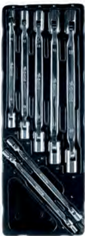
Liigendotsaga padrunvõtmete komplekt (Metric)