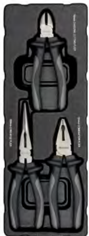
Tangid 20.420.000 3-osaline komplekt Diagonaalloiketangid 160 mm / kombineeritud tangid 180 mm / pika otsaga tangid 200 mm