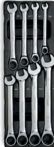
Käristiga leht-silmusvõtmed (TOLL)

12 tk (8 - 9 - 10 - 11 - 12 - 13 - 14 - 15 - 16 - 17 - 18 - 19 mm)