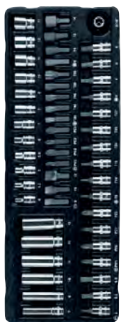
Padrunid 1/4" + 1/2" 30.001.052 52-osaline komplekt 4 - 13 mm / lapikotsikuga Phillips - Pozidriv - Torx - Kuuskant