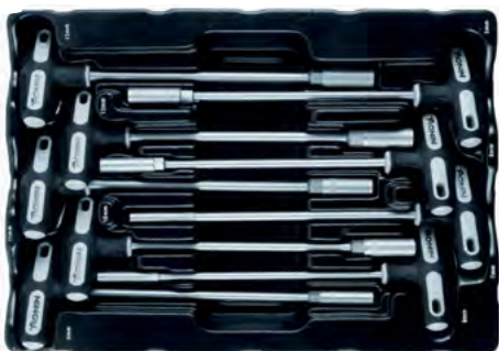
T-käepidemega padrunvõtmete komplekt

15.500.009 T-käepidemega padrunvõtmed (9 tk)