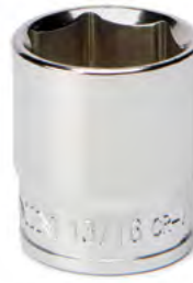
1/2" Standardpadrunid (TOLL)