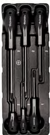
Lapik-kruvikeerajad 15.440.000 4 - 8 mm (5 tk)

Sisaldab järgnevaid sahtlisisudega komplekte: