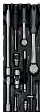
Kärstid 1/4" - 1/2" 30.001.015 Kärstid + tarvikud 1/4" - 1/2" (15 tk)