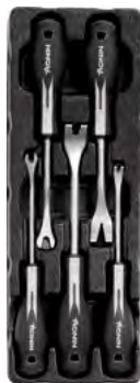
Polstri ja tüüblite eemaldushargid