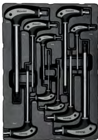
T-käepidemega kuuskantvõtmed 15.620.010 2 - 12 mm (10 tk)