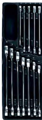
Leht-silmusvõtmete komplekt (TOLL)