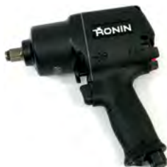
1/2" suruõhu- mutrikeeraja 30.350.100