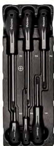
Phillips kruvikeerajad 15.430.000 PH0 - PH3 (6 tk)