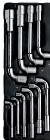
L-kujuliste padrunvõtmete komplekt

(6x7 - 8x9 - 10x11 - 12x13 - 14x15 - 16x17 - 18x19 mm)