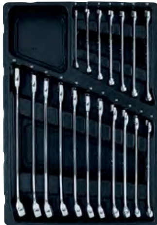
Leht-silmusvõtmed 25.310.018 6 - 23 mm (18 tk)