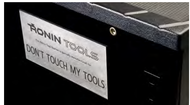
Disaini oma tööriistakapp

Disaini endale isiklik eksklusiivne nimeplaat ja muuda oma tööriistakapp personaalseks.