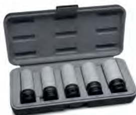
Veljemutrite padrunite komplekt (5 tk) 30.375.005