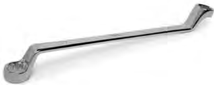
2-poolsed astmega silmusvõtmed (Metric)