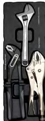
Tangid / reguleeritav mutrivõti 20.430.000 3-osaline komplekt Kullinokk-tangid 240 mm / lukustiga tangid 250 mm / reguleeritav mutrivõti 200 mm