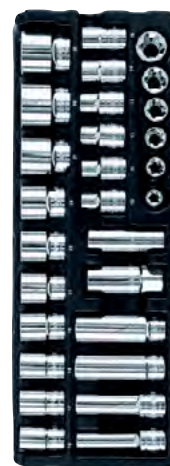
Padrunid 1/2" 30.001.028 10 - 32 mm / E12 - E43 (28 tk)