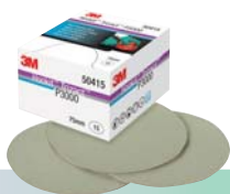
3M™ Trizact™ P3000