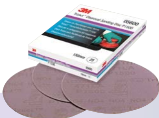
3M™ Trizact™ P1500